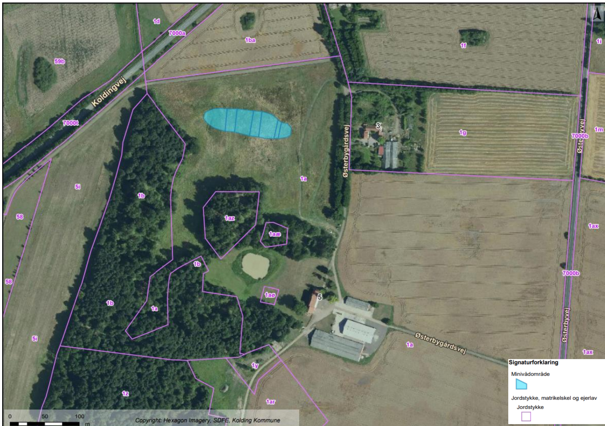
Kortbilag 2: Oversigtskort, der viser minivådområdets placering på matriklen.