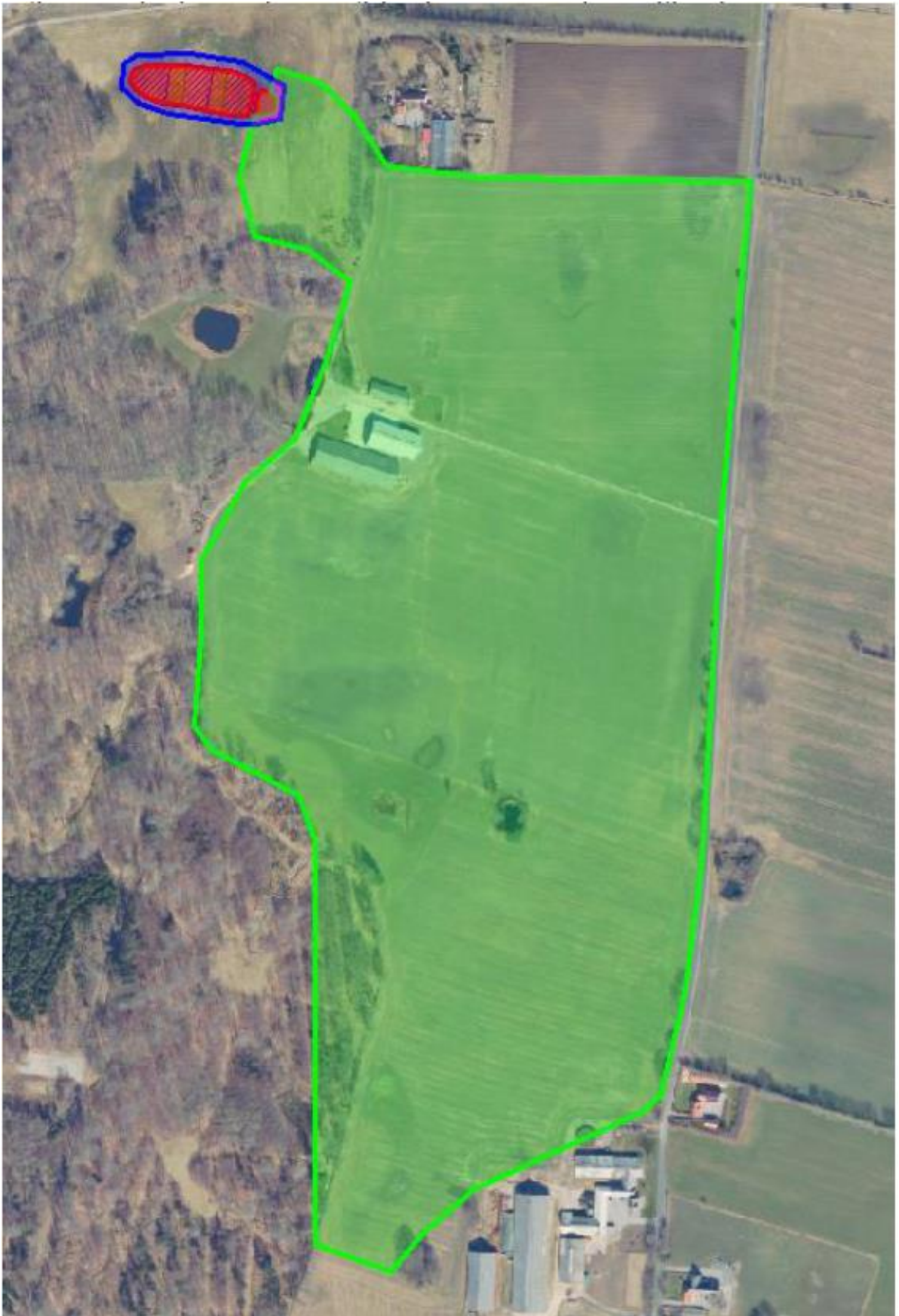
Kortbilag 4: Grøn er drænoplanet, orange projektområdet og blå minivådområdets vandspejl.