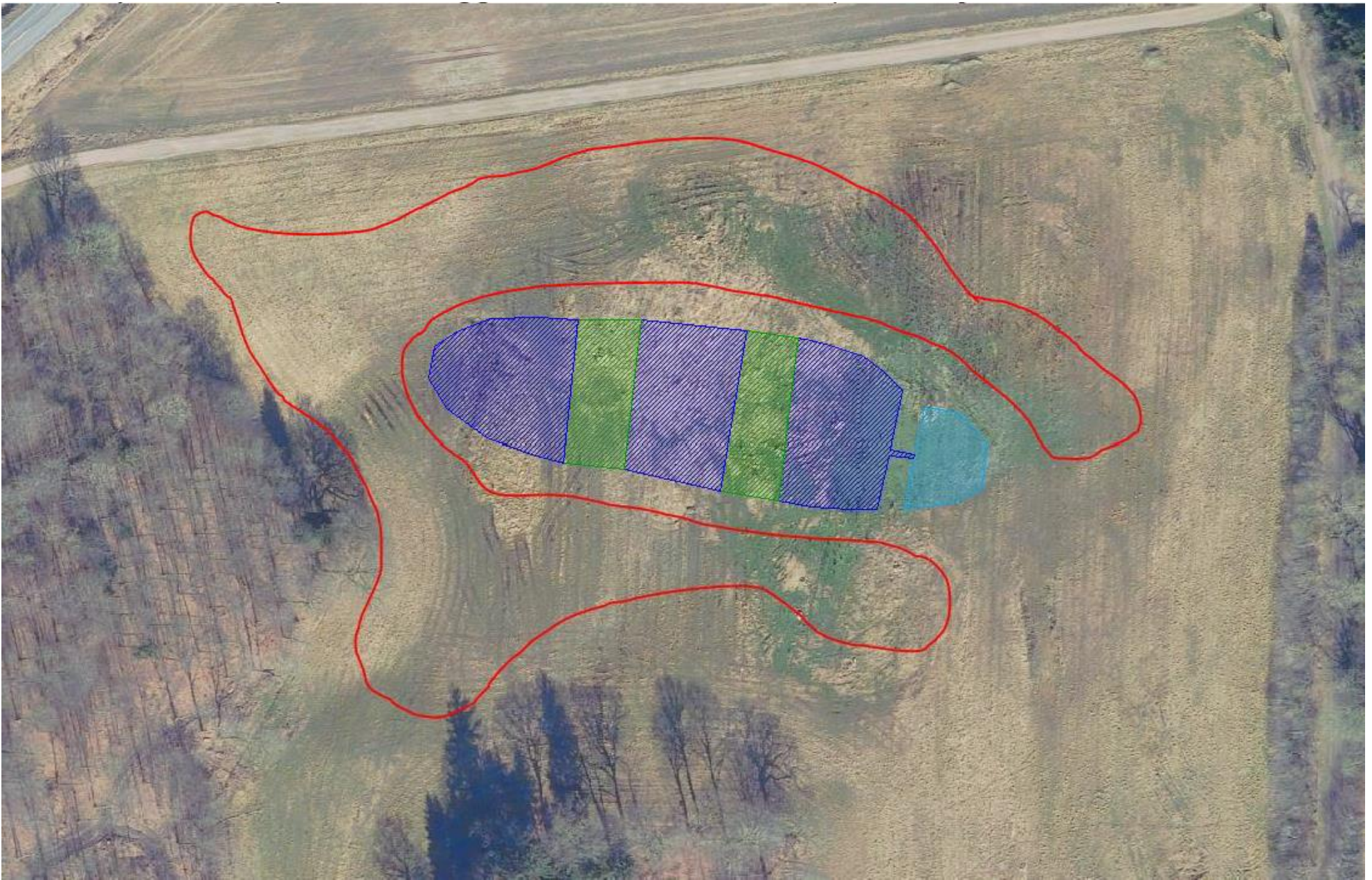
Kortbilag 3: Overskudsjorden placeres inden for den røde linje. Før udlægning afgraves muldjorden delvist (ca. 15 cm). Jorden lægges herefter ud i max 0,5 m. højde